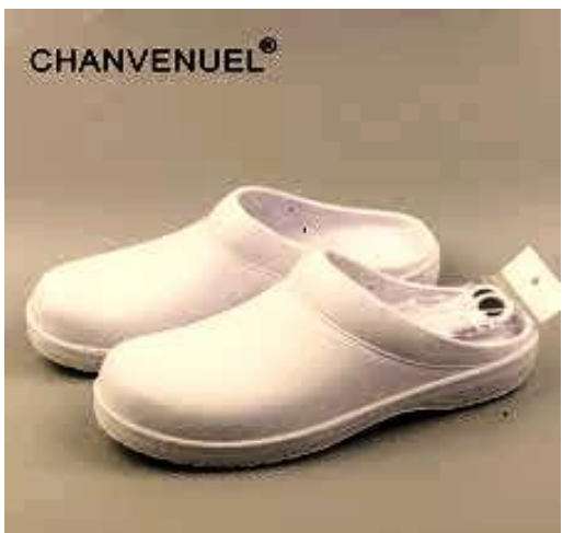
Figure 2 OR shoe