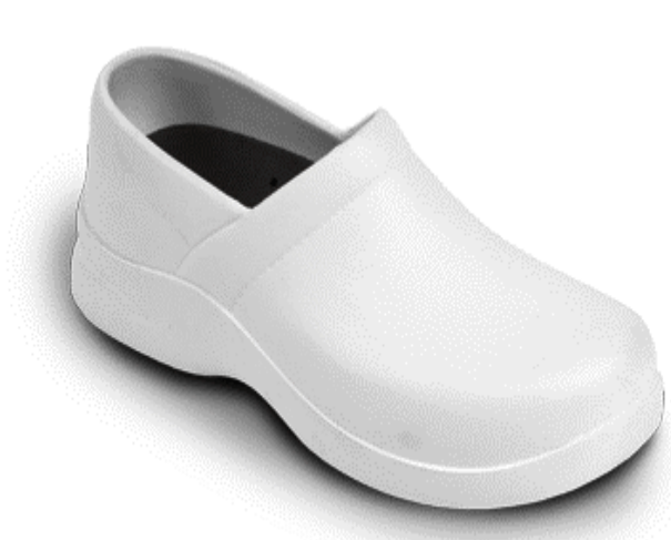
Figure 1 General shoes