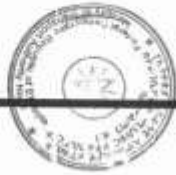
በአገር አቋራጭ የሕዝብ ማመላለሻ ደረጃ ለጎደ አውቶብሶች የሚሰጡ ክፍያ ተሽጋሪ የጉዞ መስመር ስተገልጋህ የሚሰጥ አገልግሎት

ካሳይ በተዘጋጀው መመሪያ መሠረት በአገር አቋራጭ የሕዝብ ማመላለሻ አውቶብሶች መደበኛ የጉዞ ሥምራት አገልግሎት ወቅት ስተገልጋዩ ሕዝብ ስለሚሰጥ የቀርቦ የምሳና የማደራያ ቦታዎች የተዘጋጀ ዝርዝር